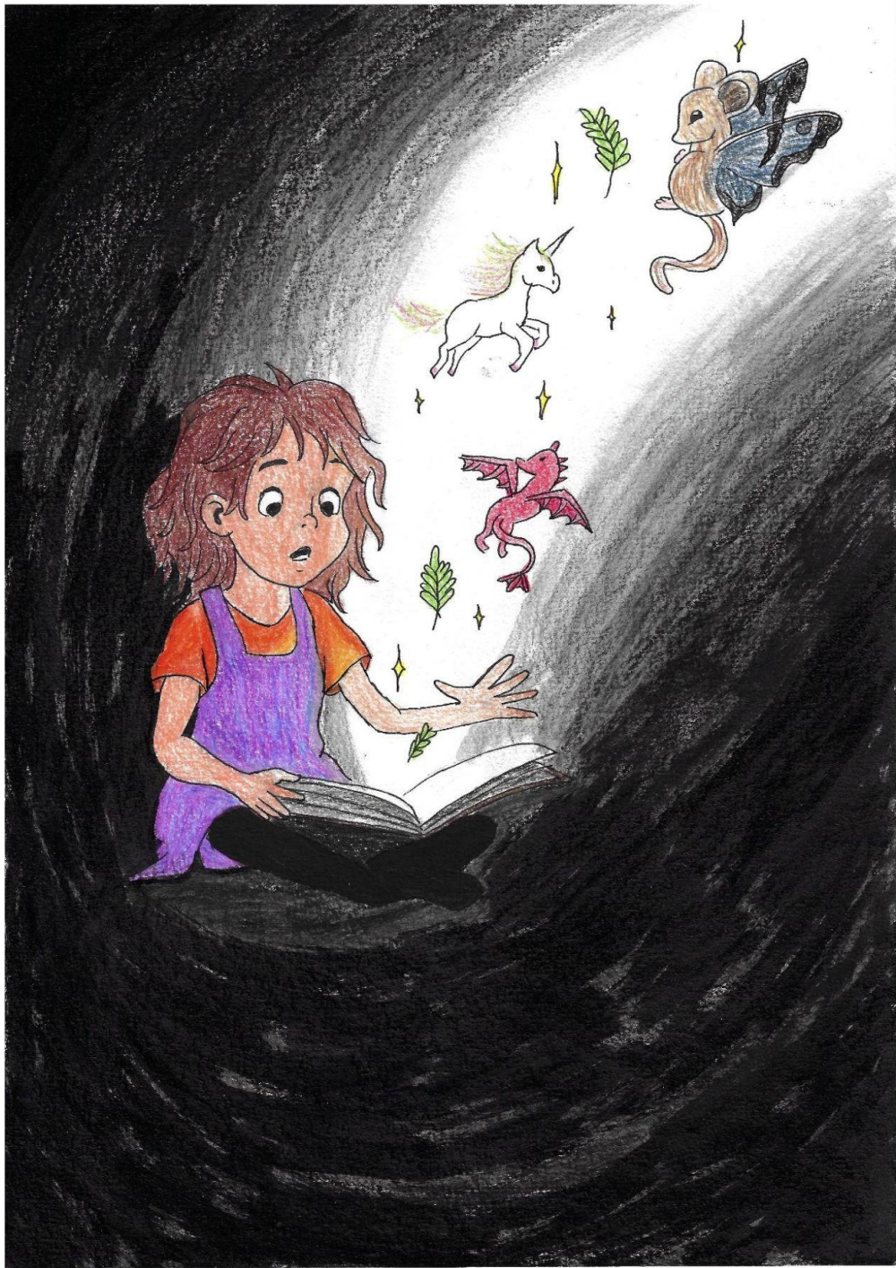
Magie de croire Illustration de Safiya