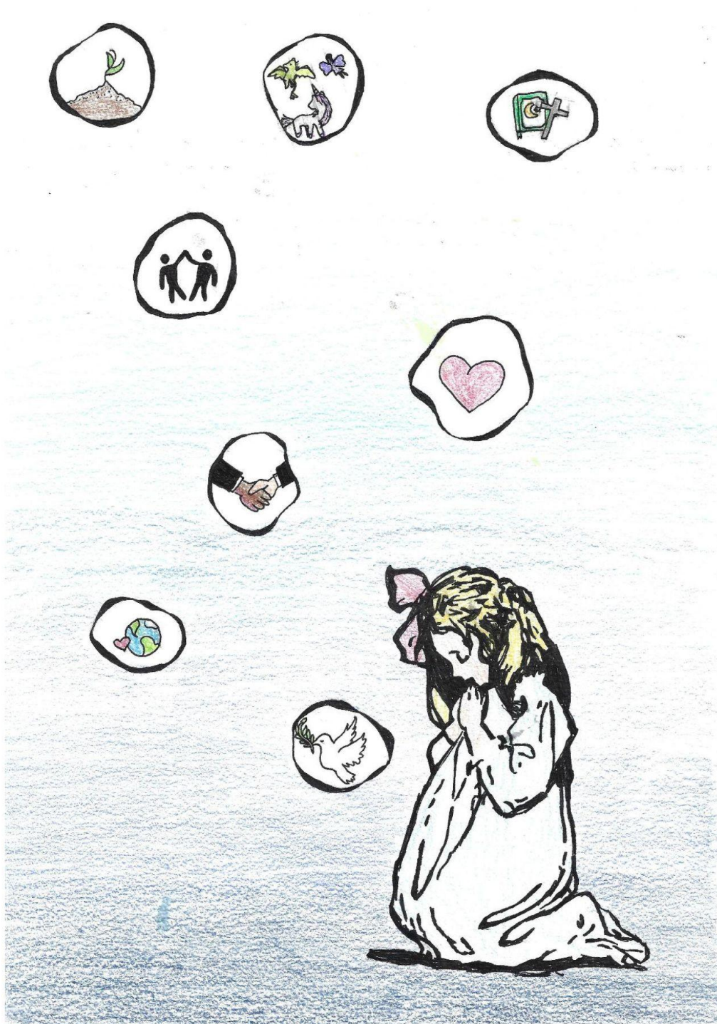
Mille et un vœux Illustration de Soumeya