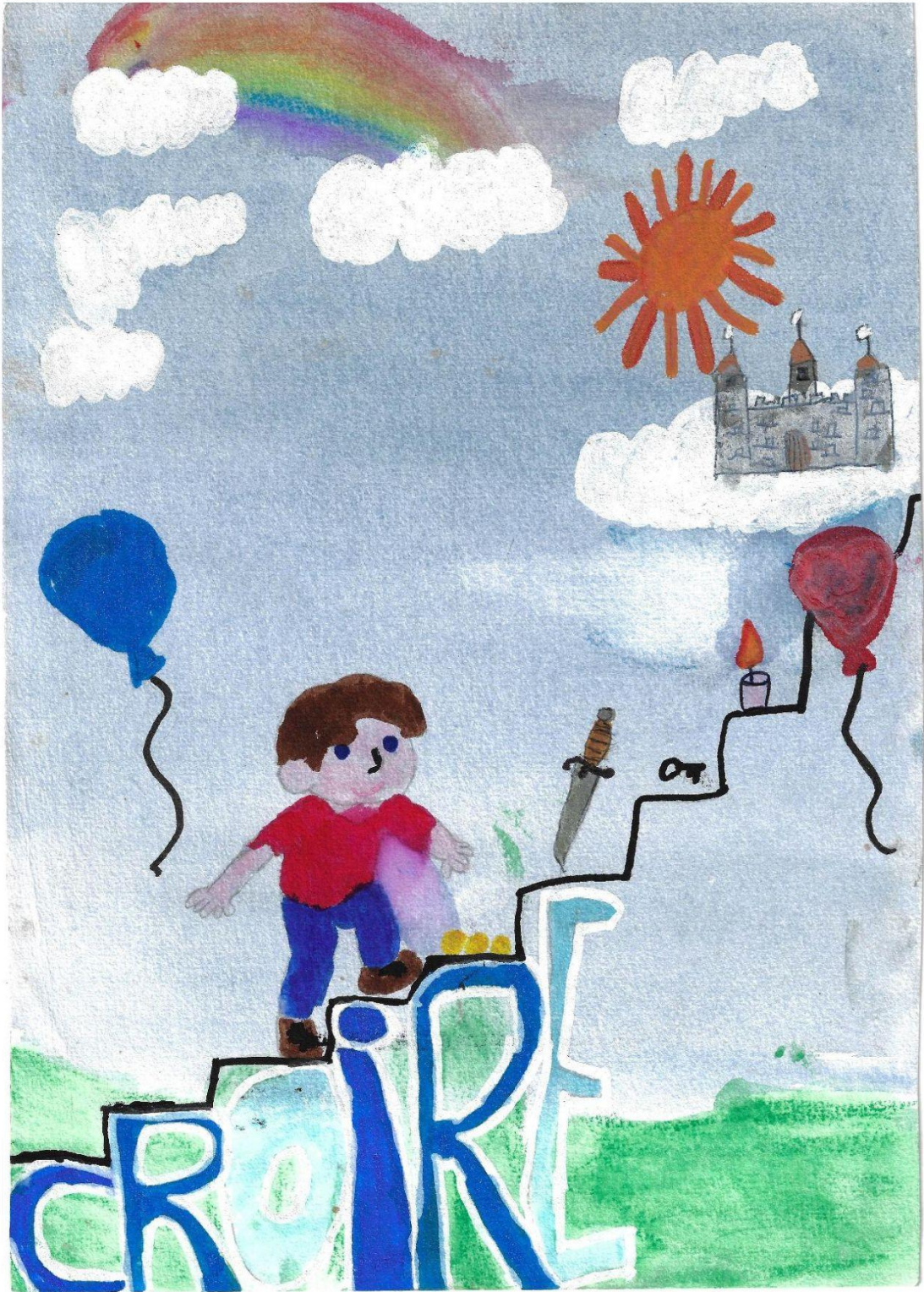
Monter vers ses rêves Illustration de Souleymane